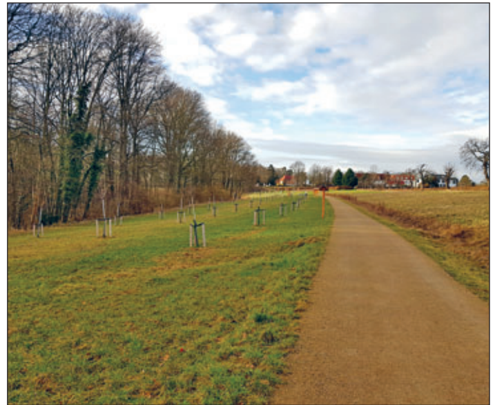
Am Geh- und Radweg durch Brumms Grund gibt es jetzt neun Sitzbänke.