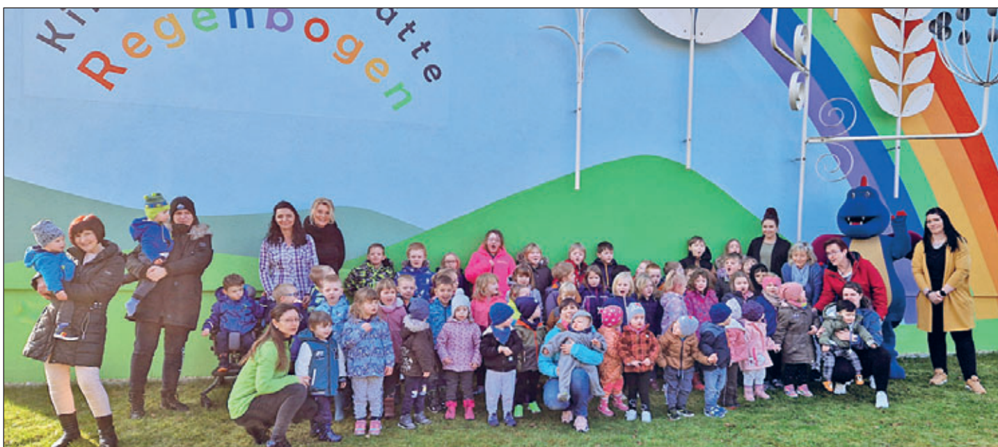
Zum Abschluss des Besuches von Meerano in der Kita „Regenbogen“ gab es ein Foto vor dem Kita-Gebäude.