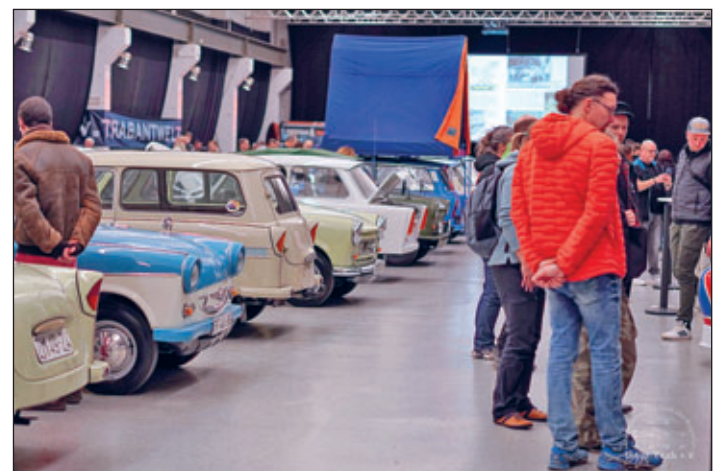
Der Intertrab e.V. lädt unter dem Motto „Trabi & Friends“ anlässlich der 850-Jahrfeier zu Stadtrundfahrten und zur Ausstellung „Historische Fahrzeuge“ in der Neobarocken Post ein.