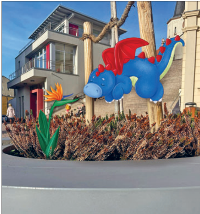
Der kleine Drache Meerano und seine Drachenblume.

Oder war es der vierte Gang ganz vorne rechts? Nach langem Suchen habe ich sie dann aber gefunden: eine echte, ganz besondere Drachenblume.