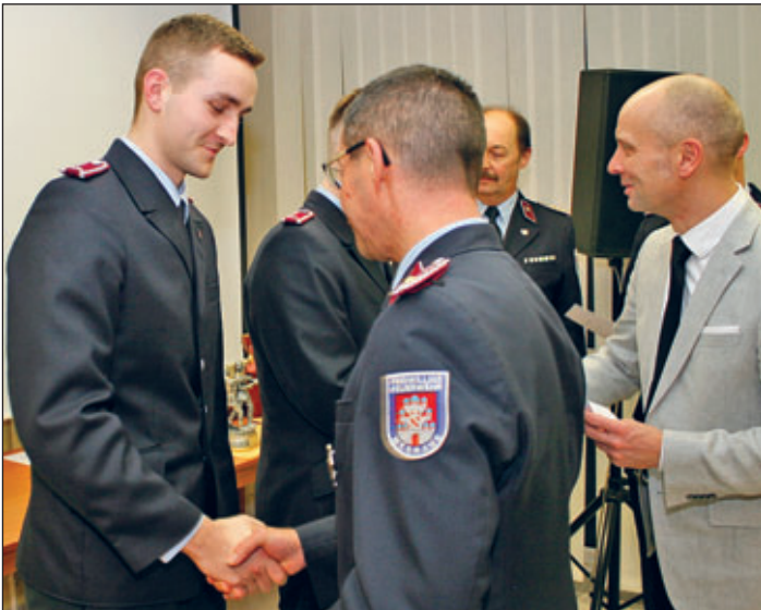
Übergabe der Urkunden für Ehrungen und Beförderungen zur Jahreshauptversammlung der Feuerwehr Meerane.