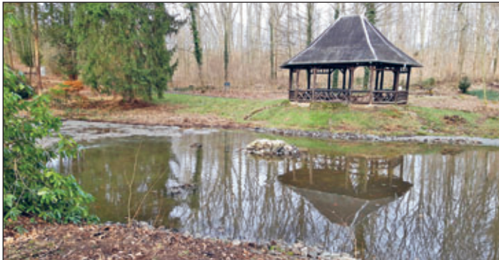
Das Foto auf Seite 21 zeigt den Zustand vor dem Beginn der Säuberungsarbeiten. Nach Fertigstellung wurde der Ententeich wieder befüllt.

Nach dem Abpumpen des Wassers wurden Schlamm, Äste und Laub entfernt, ab 22. Februar konnte der Teich wieder mit Wasser befüllt werden. Genutzt wurde dafür Wasser aus dem Tiefbrunnen in der Parkanlage Wilhelm-Wunderlich-Park, informierte Sabine Schumann, Sachgebietsleiterin Umwelt der Stadtverwaltung Meerane.