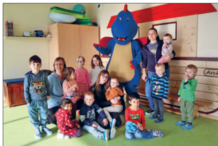
Bei den Kindern in der Kita „Arche Noah“ kam Meerano gut an, auch wenn der eine oder andere erst mal kurz abgewartet hat, was denn der große Drache im Spielzimmer macht!