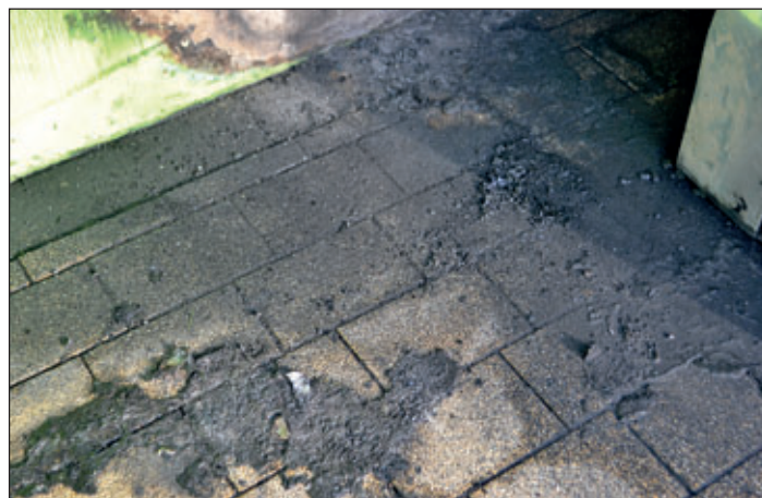
Schadensbilder nach der Brandstiftung am Bahnhofsgebäude.