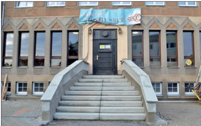
Die neue Eingangstreppe an der Frontseite zur Friedhofstraße.