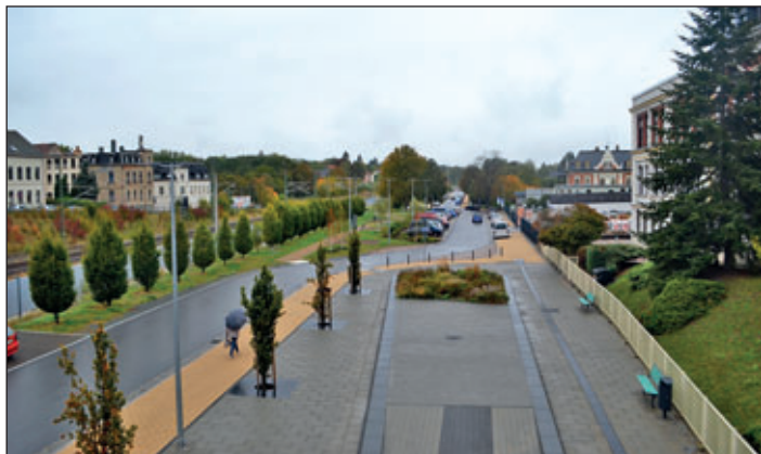
Blick von der Brücke über die Bahn (Meer 38) in Richtung des fertiggestellten 3. Bauabschnittes (Foto oben) und in Richtung Bahnhof Meerane.