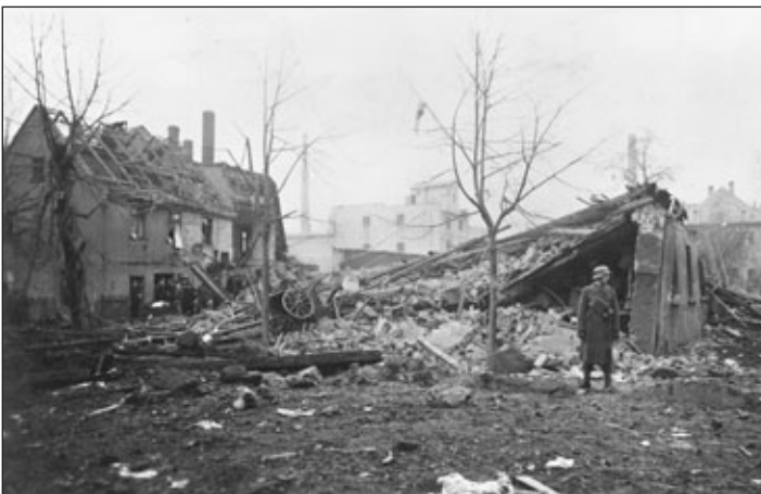
Johannisstraße / Ecke Merzenberg nach dem Bombenabwurf am 13./14. Februar 1945.

Die Menschen erfuhren jedoch in den Jahren 1939 bis 1945 leidvoll, was Krieg bedeutete. Zu Kriegsende lag ganz Deutschland, ganz Europa in Trümmern. Alliierte Soldaten bargen Überlebende aus den Lagern. Millionen deutscher Familien wussten nicht, ob ihre Väter, Söhne und Brüder zurückkehren würden, Bretterzäune hingen voll mit Suchmeldungen des Roten Kreuzes. In den Straßen sah man Kriegsversehrte und Flüchtlinge, Kinder hatten Unterricht in Behelfsbaracken. Aber die Bomber dröhnten nicht mehr durch die Nacht, und in Europa endete die Menschenjagd der Nationalsozialisten. Kriegsende war ein tröstliches Wort.