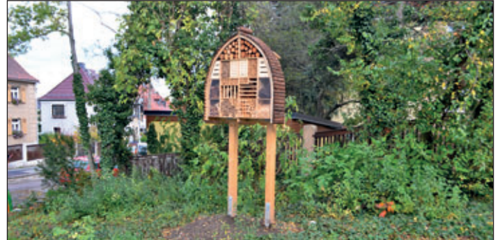
Vögel und Insekten willkommen!

Angedacht ist auch, im Winter Meisenknödel und -ringe am Insektenhotel anzubringen.