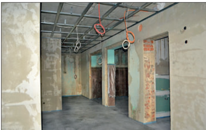
Heizraum und Rohinstallation im Sanitäranbau.

Gefördert über das Bundesprogramm „Sanierung Kommunalen Einrichtungen in den Bereichen Sport, Jugend und Kultur“ können die Maßnahmen umgesetzt werden.