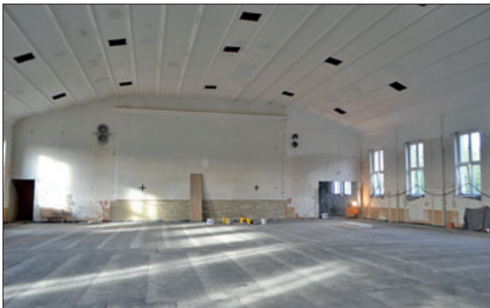
Blick in die Mehrzweckhalle.