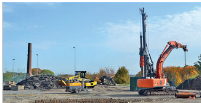
Arbeiten zur Herstellung der Bohrpfahlgründung für die Flutlichtanlage (22. Oktober 2020).

Mitte Oktober starteten die Bohrarbeiten zur Herstellung der Bohrpfahlgründung für die Flutlichtanlage, die bis Mitte November 2020 abgeschlossen werden sollen, informiert Kerstin Götze vom Dezernat Bauwesen und Umwelt der Stadtverwaltung. Es werden 32 Stück Bohrpfähle aus Stahlbeton mit einer Länge von ca. 6 bis 12 Meter zur Stabilisierung des Baugrundes hergestellt. Danach erfolgt die Betonage der Köcherfundamente, in die die Flutlichtmasten eingesetzt werden.