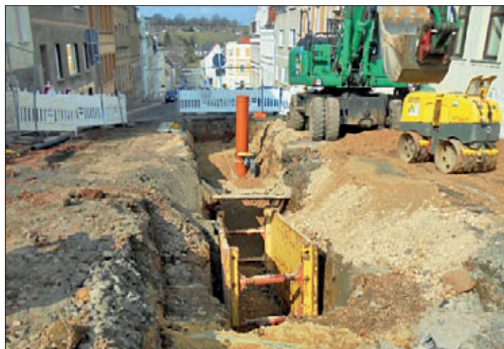
Das Foto zeigt den Baustand am 27. März 2018.

Wie schon im 1. und 2. Bauabschnitt werden neben Straße