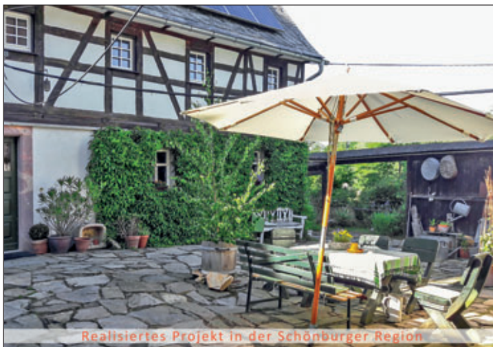
Realisiertes Projekt in der Schönburger Region

Nähere Informationen zu den Fördermöglichkeiten sowie bereits realisierter Vorhaben finden Interessenten auf der Internetseite www.region-schoenburgerland.de . Außerdem steht Ihnen das Team vom Regionalmanagement Schönburger Land mit Rat und Tat zur Seite und wünscht viel Erfolg bei der Realisierung Ihres Vorhabens!