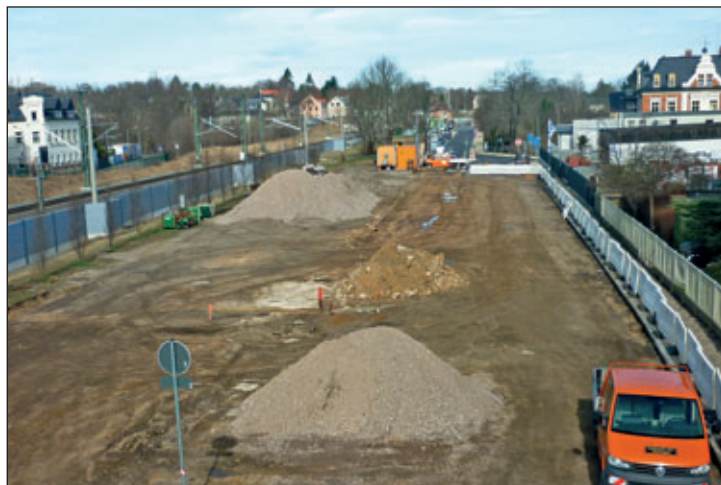
Das Foto zeigt den Baustand am 3. April 2018.

Die Arbeiten begannen mit der Beräumung der vorhandenen Oberflächenbefestigung. Diese wurde sortiert und zwischengelagert; das vorhandene Granitpflaster wird zum Teil wieder verbaut. Im Anschluss erfolgte die Verlegung des neuen Abwasserkanals für die Oberflächenentwässerung, informierte Birgit Jantsch, Dezernentin Bauwesen und Umwelt der Stadtverwaltung Meerane.