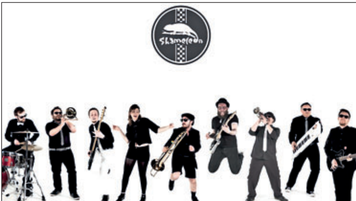
Skameleon wird sich am Sonntag, 17. Juni 2018, auf dem Meeraner Parkfest vorstellen.

Am Sonntag wird die Band Skameleon für Stimmung und gute Laune sorgen.