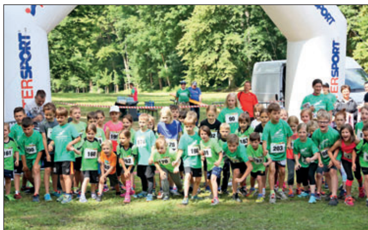
Start zum Kids-Lauf (6-9 Jahre) Meerathon 2017.

Die Anmeldung nehmen die Mitarbeiter aller GÜ-Sport-Filialen vom 15. April bis zum 8. Juni 2018 entgegen. Kinder und